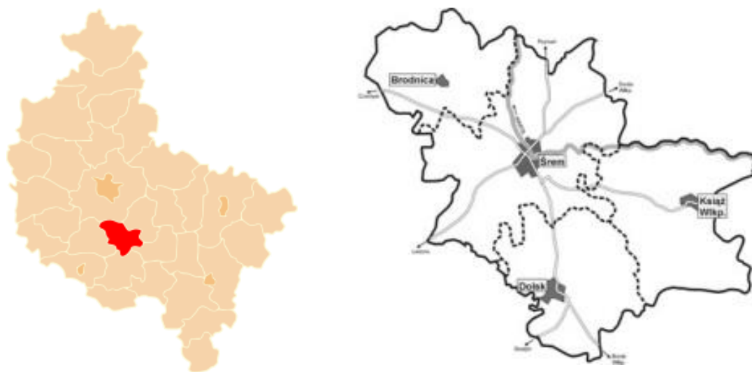
Rysunek 1. Powiat Śremski w Wielkopolsce

Powiat Śremski leży w centralnej części województwa wielkopolskiego, sąsiadując z pięcioma powiatami: gostyńskim, jarocińskim, kościańskim, poznańskim i średzkim. Odległość między centralnie położonym miastem powiatowym Śremem, a stolicą województwa - Poznaniem wynosi 42 km.