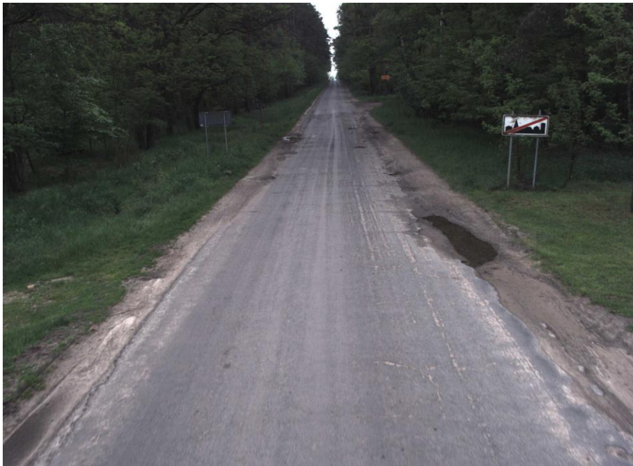
Droga powiatowa nr 2480P w Kalejach po modernizacji