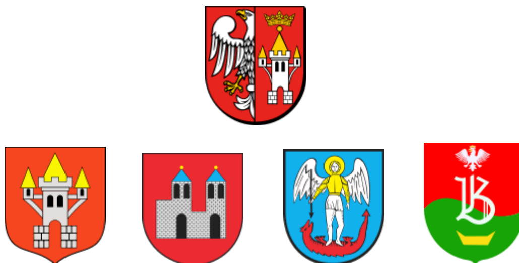
Rysunek 2. Herb Powiatu Śremskiego oraz poszczególnych gmin

Powiat tworzą 4 gminy. Trzy z nich są miejsko-wiejskie: Śrem, Książ Wielkopolski, Dolsk, a jedna wiejska: Brodnica. Odległość pomiędzy Śremem a siedzibami urzędów w poszczególnych gminach wynosi od 12 do 20 km.