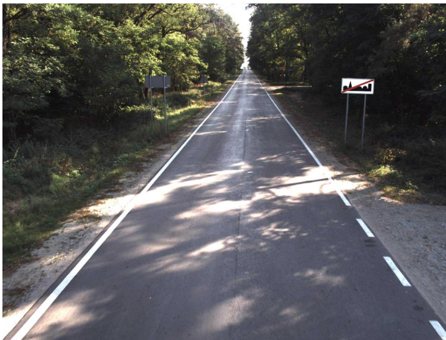
Droga powiatowa nr 4070P na odcinku Jarosławki – Konarskie przed modernizacją