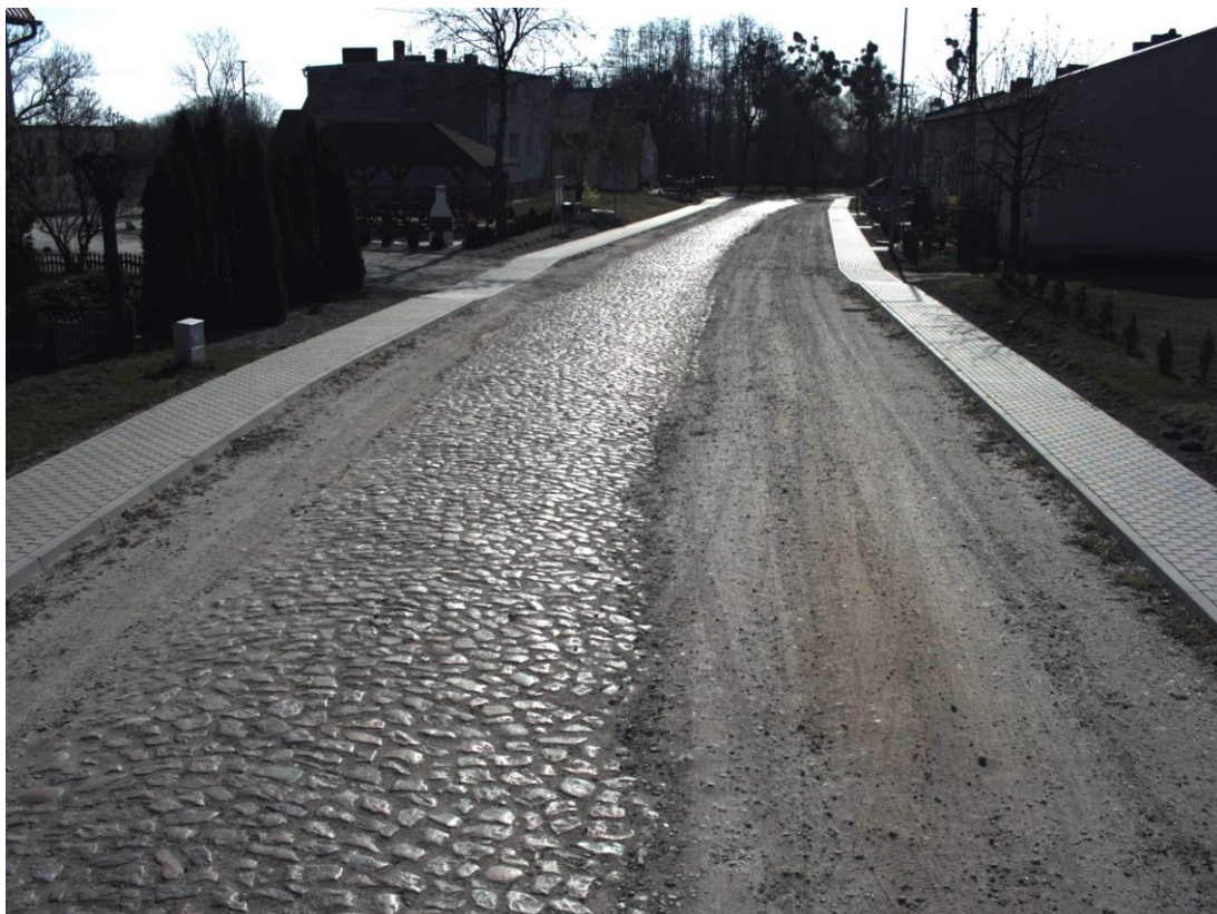
Droga powiatowa nr 4070P na odcinku Jarosławki – Konarskie po modernizacji