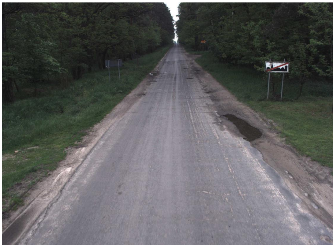
Droga powiatowa nr 2480P w Kalejach po modernizacji