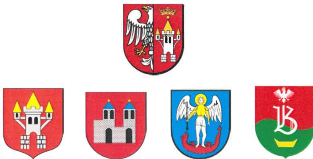
Rysunek 2. Herb Powiatu Śremskiego oraz poszczególnych gmin

Powiat tworzą 4 gminy. Trzy z nich są miejsko-wiejskie: Śrem, Książ Wielkopolski, Dolsk, a jedna wiejska: Brodnica. Odległość pomiędzy Śremem a siedzibami urzędów w poszczególnych gminach wynosi od 12 do 20 km.