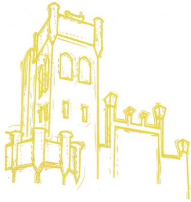
Dom Pomocy Społecznej w Psarskim